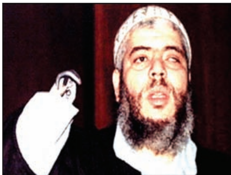
Riba un foto di archivo, por mira e Iman Radical Abu Hamza al Masri.

LONDON—E Iman radical Abu Hamza Al Masri, yama Capital Garfio, despues di e perde un man y un wowo den e guera di Afghanistan contra e ex Union Sovietico, lo sinta den e banki dialuna na London den un huicio cu lo oponden fin na e tolerancia Britanico cu e extremistanan musulman despues di e atentado na juli ultimo.